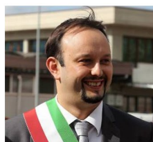
IL SINDACO PAOLO OMOBONI

Un Bilancio di previsione difficile, come per tutti i Comuni, quello del 2021 per il Comune di Borgo San Lorenzo, approvato con i voti favorevoli dei gruppi PD e Gruppo civico. Lo spirito di fondo è quello di cercare di tutelare famiglie e imprese : per il 2021 infatti non ci saranno aumenti di imposte